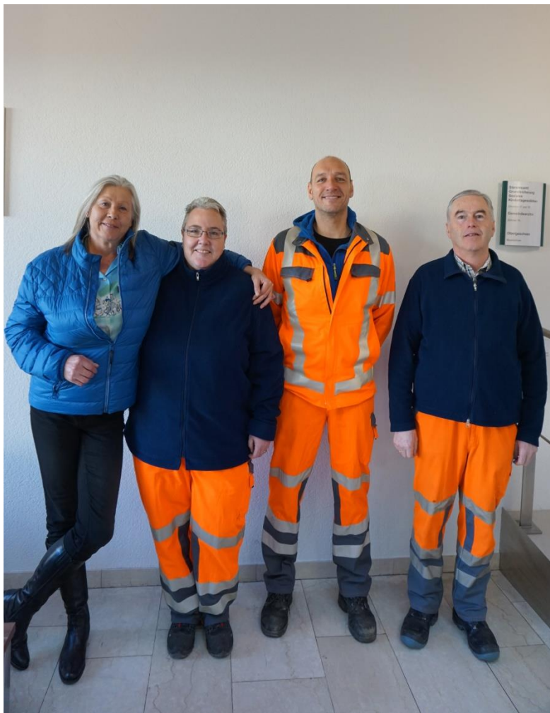
Unsere Mitarbeiter/innen vom Wertstoffhof

• Wertstoffhof - an 5 Tagen in der Woche geöffnet - Dienstag bis Samstag