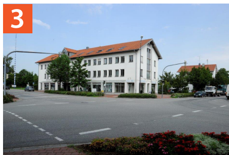
Kreuzungsbereich Münchener Straße / Wolfratshausener Straße