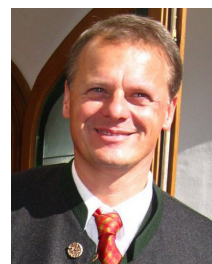
Vertreter der Gemeinde bei der Verkehrswacht München Klaus Zimmermann 2. Bürgermeister