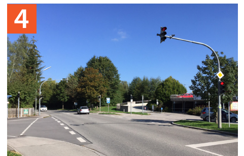
Kreuzungsbereich St 2573 / Von-Aychsteter-Straße