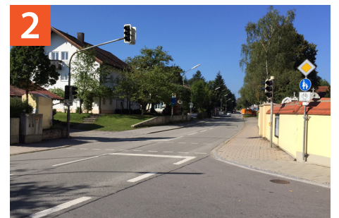
Querungshilfe Wolfratshausener Straße an der Kirche